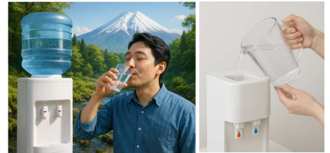
イメージ画像生成元：ChatGPT（DALL・E） - OpenAI